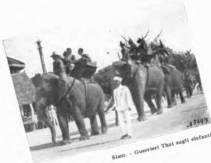
Siam. - Guerrieri Thai sugli elefanti.