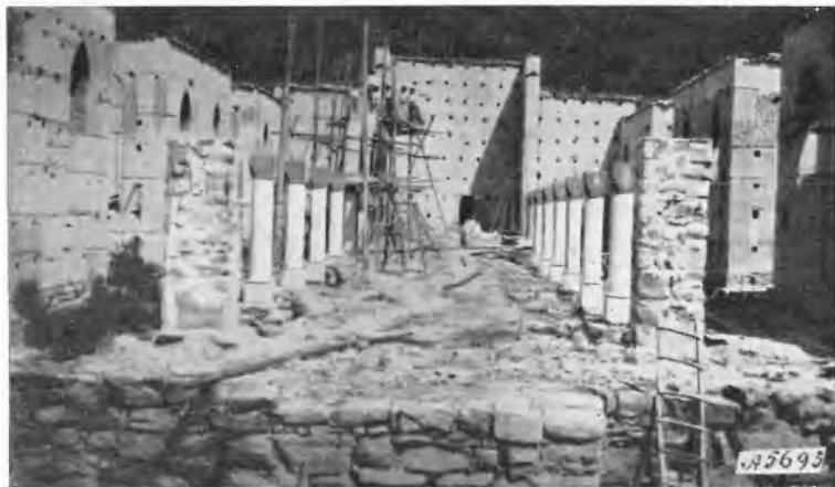
El Guacamayo. - La chiesa in costruzione.

modo e godono quando mi vedono passare. Il campo di lavoro è assai vasto e, se si vuole, un po' difficile per l'indole dei ragazzi e per la complicazione che presenta una Casa sui generis come questa.