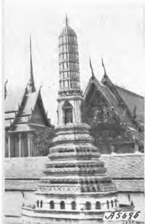
ità delle pagode

Questo suo desiderio è ormai realtà. Riservo ad una prossima relazione le notizie del lavoro che compiamo nel nuovo campo; per ora mi limito a qualche cenno dell'ambiente che in questi giorni è sotto l'influsso quasi d'un senso di rinnovamento per la recente disposizione che ha mutato il nome del Paese da Siam in Thai .