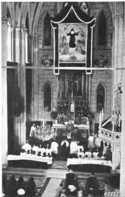
Gerusalemme. - Nella concattedrale per le feste ad onore della Beata Mazzarello.