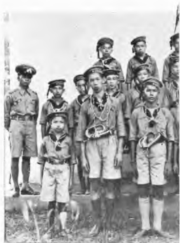
Siam. - Gioventù Thai nella d