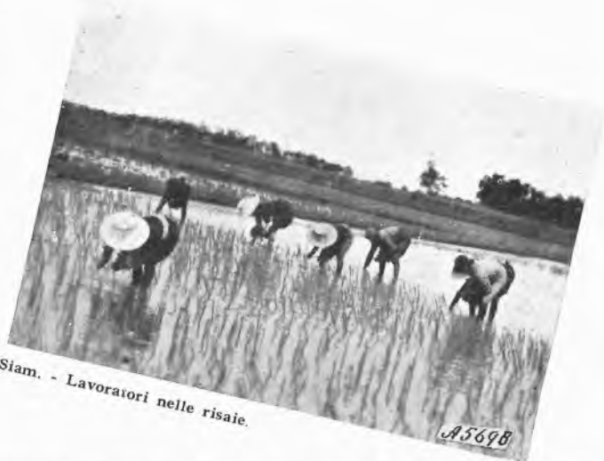
Siam. - Lavoratori nelle risaie.