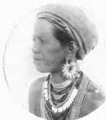
Assam. - Aspetto ed ornamenti di una donna Garo.