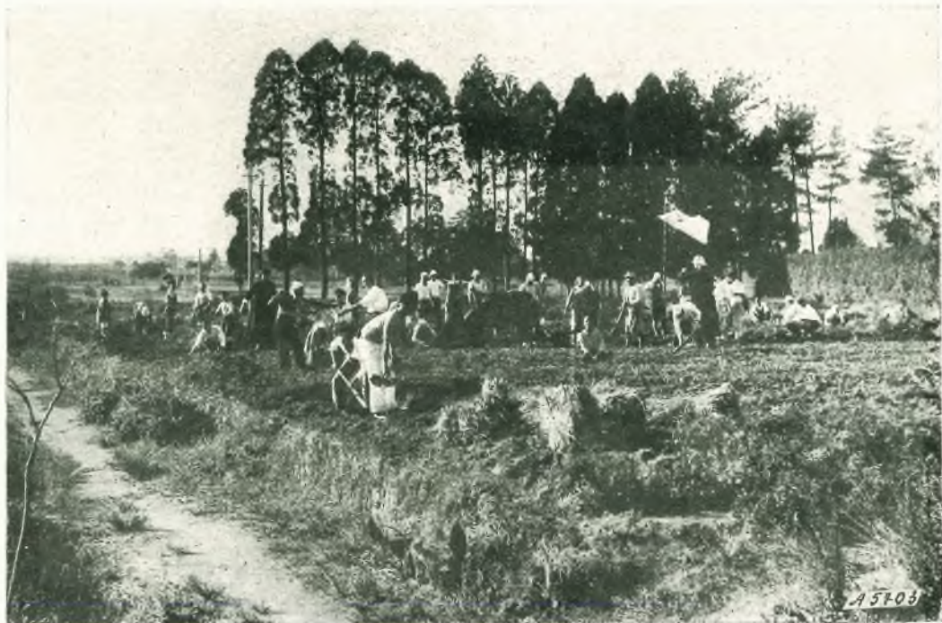
Miyazaki (Giappone). - I nostri seminaristi al lavoro in aiuto alle famiglie dei soldati.

Uno spettacolo nuovo e singolare che s'impose alla gente del luogo e parve un simbolo e una promessa della materna protezione dell'Ausiliatrice sulle povere indie del Chaco, vicine a Lei in quelle primizie di vita cristiana.