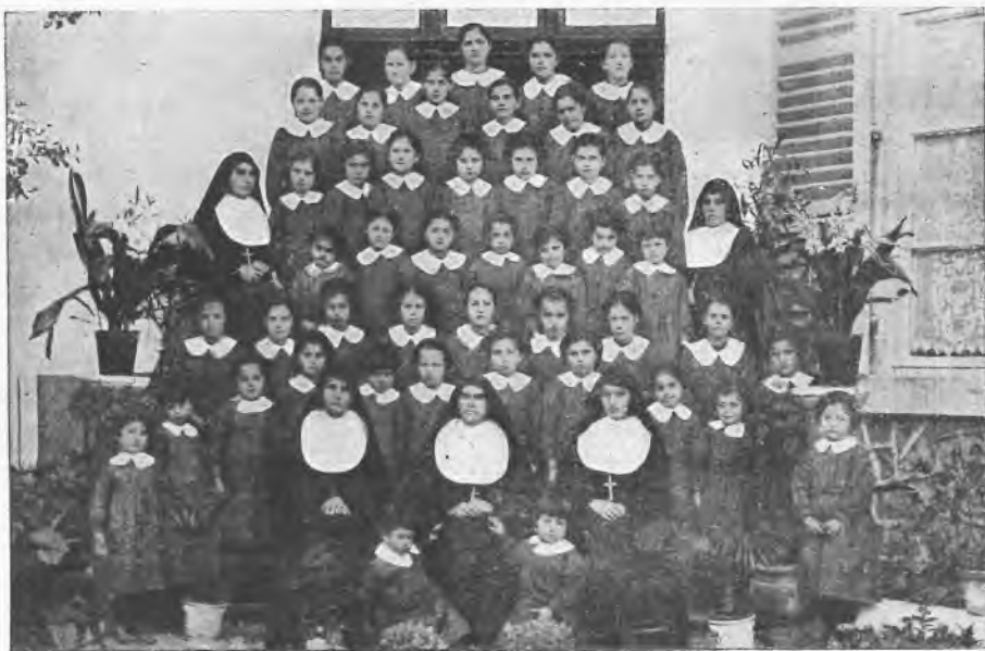
Scutari (Albania). - Gruppo di orfanelle.

L'Ospedale «Principessa Jolanda», tanto ben visto dalla popolazione, è sempre più fre-