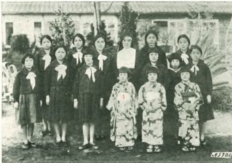
Miyazaki (Giappone). - Aspiranti all'Istituto delle Suore giapponesi della Carità.

Se sarà nei disegni della Divina Provvidenza che le due suore della Carità giapponesi un bel giorno siano 20.000 e l'unica Casa che è a Miyazaki ne vegga sorgere altre 20.000, si può sperare che la stessa Divina Provvidenza muova queste rondinelle a spiccare il volo verso lidi anche lontani, e le infiammi di zelo santo, operoso, in guisa che il loro resoconto annuale, mentre somiglierà al canto che gli uccelletti si mandano di fronda in fronda, sarà sopra tutto un inno a quel Cuore che ha tanto amato gli uomini. Ci aiuti lei, amatissimo Padre, colla sua benedizione.