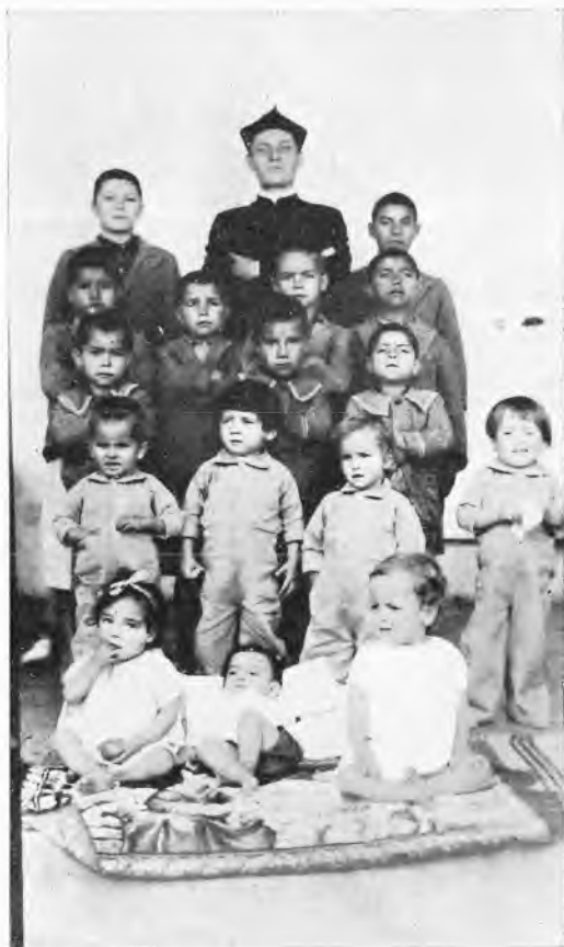
El Guacamayo. - Rappresentanti delle generazioni dell'asilo per figli di lebbrosi: da 4 mesi a 16 anni.

modo e godono quando mi vedono passare. Il campo di lavoro è assai vasto e, se si vuole, un po' difficile per l'indole dei ragazzi e per la complicazione che presenta una Casa sui generis come questa.