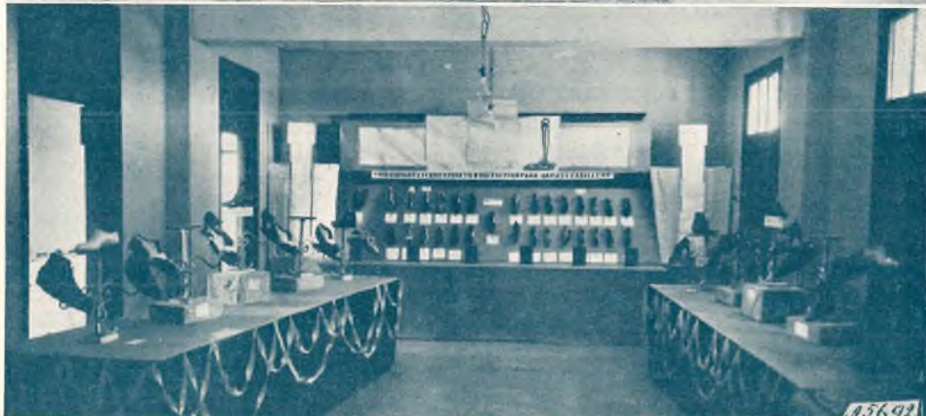
CIUDAD DE TRUJILLO (Santo Domingo). - Due sa'e della mostra delle nostre Scuole Professionali con gli alunni interni dopo la premiazione presieduta dallo stesso Ministro della Educazione Nazionale.