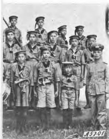
delle organizzazioni nazionali.

Cambiare nome è un po' nella tradizione del popolo. Quante volte, ai bambini si appiccica un nome che ricorda una circostanza della nascita (per esempio: «quando pioveva»), oppure una qualità fisica (come «macchia sulla fronte») ecc. Tutti i bambini poi, nel linguaggio familiare sono chiamati col vezzeggiativo comune di «topolino».