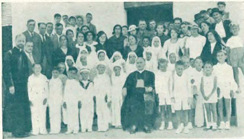
Vaiguras. - Piccoli comunicandi.