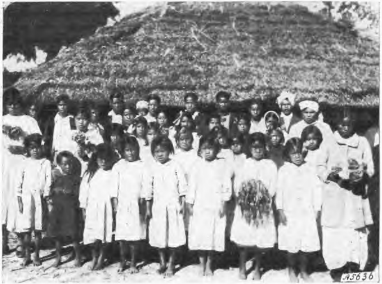
Assam. - Una nuova comunità cristiana

E questo fu un premio anche per le Missionarie; giacchè videro come la giovane vincitrice della gara non possedesse il catechismo solo nella mente, ma soprattutto lo portasse nel cuore!