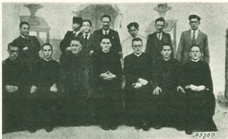
El Guacamayo. - Il personale salesiano.

Gradisca, amatissimo Padre, i filiali saluti di tutti i Salesiani e bambini di questo asilo, che per lei elevano preghiere al Signore e implorano una sua benedizione speciale.