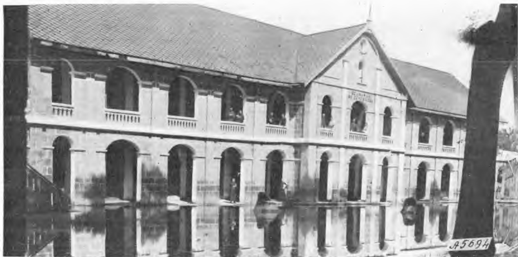
Bang-Nok-Khuek (Siam). - Lo studentato salesiano durante la stagione delle inondazioni.