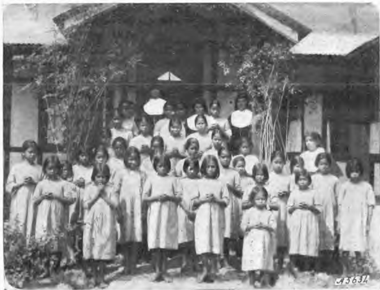
Jowai. - Orfanotrofo Beata Mazzarello.

Dopo il ritorno dallo sperduto paesello di Pak-Heong, dove per interessamento di S. E. Rev.ma Mons. Vicario Apostolico cercarono scampo per alcuni mesi, non poterono godere a lungo della relativa tranquillità che speravano.